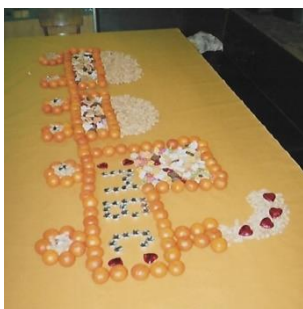
Klublogo – Chlausabend