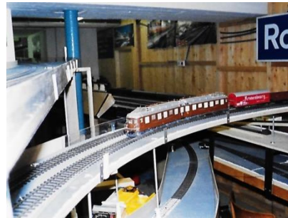
Ae 8/8 fährt hoch zum Wendelbahnhof