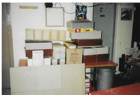
bereit für den Umzug in den neuen MBC