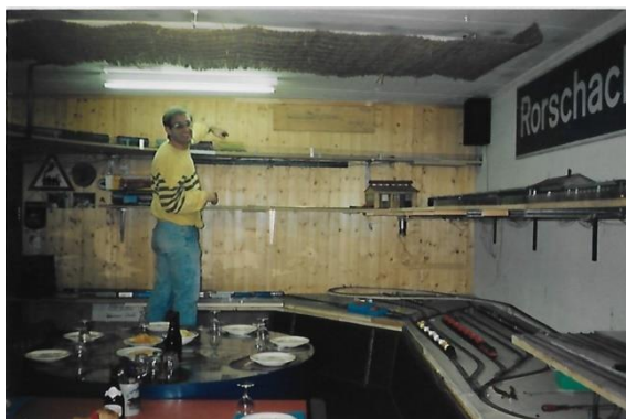
Für die Kleinsten im Klub – Märklin H0 Anlage