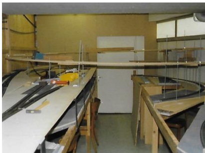
unter Wendel des „Hundeknochen“

Aussergewöhnlich bei diesem Anlagentyp war aber, dass sich die eine Wendeschleife ca. 50 cm unter der Decke im Bereich des Warenlift bzw. Aufenthaltsraum befand. Die Wendeschleife war zugleich der 2. Bahnhof auf der Anlage. Die Bedienung des Stellpults erfolgte problemlos, aber stehend auf einem Tisch.