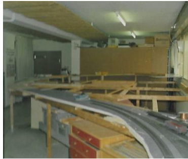
Ausfahrt Schattenbahnhof – obere Wendel Nebenlinie nach Beromünster