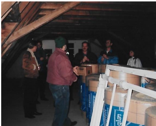
Weihnachtsapéro 1995 im neuen Klublokal

Immer mehr Rollmaterial standen auf der Wunschliste einzelner Mitglieder. Langsam aber sicher füllten sich die Gleise. Der Wunsch nach einer neuen, grösseren Anlage war immer wieder Gesprächsthema. Noch ahnte niemand, dass 1995 DIE grosse Veränderung für den MBC kommen würde !