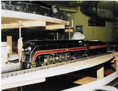
US-Fans auf Besuch

Wir waren fleissig und konnten schon bald die ersten Züge über die Anlage fahren lassen. Immer wieder – wie so üblich beim Anlagenbau – wurde geändert, erweitert oder eine (oder mehrere!?) Weiche(n) mehr eingebaut. Wir hatten den Plausch an unserer Anlage mit dem „ausgeklügelten“ Gleisplan und dem anspruchsvollen Fahrbetrieb.