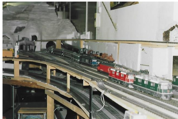
Letzter Fahrbetrieb auf der Anlage