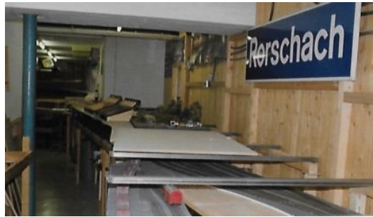
oberer Bahnhof im Aufbau – erste Gleise verlegt (vorne 0m Fama)